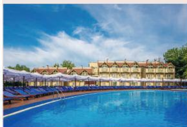
Alean Family Resort & Spa Doville

В СЕТЬ СЕМЕЙНЫХ ОТЕЛЕЙ ALEAN FAMILY RESORT COLLECTION ВХОДЯТ: