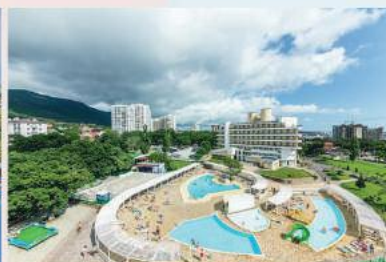
Alean Family Resort & Spa Biarritz