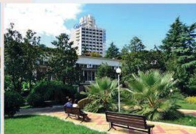
Alean Family Resort & Spa Sputnik