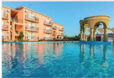
Alean Family Resort & Spa Riviera